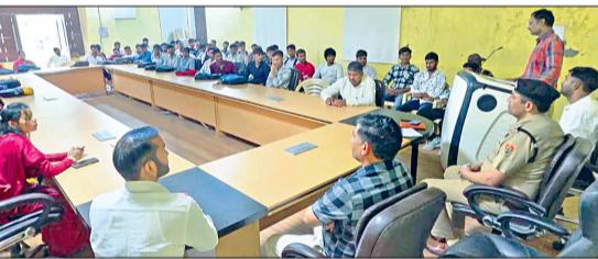
महेन्द्रगढ़। कॉलेज में नशे के खिलाफ कार्यक्रम में भाग लेते हुए।

राजकीय महाविद्यालय में नशा मुक्ति अभियान एवं सतर्कता जागरूकता सप्ताह के अंतर्गत एक विशेष जागरूकता कार्यक्रम का आयोजन किया गया। कार्यक्रम का उद्देश्य विद्यार्थियों में ईमानदारी, सत्यनिष्ठा, सुशासन तथा नशे से दूर रहकर एक स्वस्थ, जिम्मेदार एवं जागरूक नागरिक बनने की भावना को प्रोत्साहित करना था। कार्यक्रम से पूर्व महाविद्यालय की एंटी ड्रग सेल के तत्वावधान में नशा मुक्ति पर स्लोगन लेखन प्रतियोगिता का आयोजन किया गया। प्रतियोगिता में विद्यार्थियों ने नशे के दुष्परिणामों पर विचार प्रभावशाली स्लोगनों के माध्यम से प्रस्तुत किए। शहर थाना