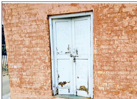
नारनौल। मंडी में स्थित गेटपास कार्यालय पर लगा ताला।

में मार्केट कमिटी सचिव ने व्यापारियों के आग्रह पर दो दिन यानी मंगलवार व बुधवार को नए गेटपास जारी नहीं करने का निर्णय लिया गया था। किसानों ने अपील की जाती है कि बुधवार को गेटपास जारी नहीं किए जाएंगे। इसलिए किसान बुधवार को भी अनाज मंडी में बाजरा लेकर न आए।