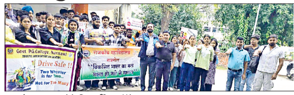
नारनौल। शपथ लेते विद्यार्थी व कॉलेज स्टाफ।