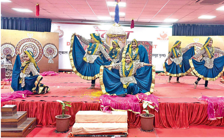
नारनौल। सांस्कृतिक कार्यक्रम प्रस्तुत करती छात्राएं।

अब विजेता प्रतिभागी टीम में राज्य स्तर पर अपनी प्रतिभा का प्रदर्शन करेगी। जिला स्तर पर विजेता टीम को मेडल पहनाकर सम्मानित किया गया। इस दो दिवसीय कार्यक्रम में 27 अक्टूबर को बालकों के लिए व 28 अक्टूबर को बालिकाओं के लिए प्रतियोगिताएं आयोजित की गईं।